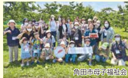
角田市母子福祉会