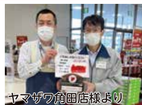
ヤマザワ角田店様より