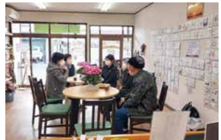
▲昨年のカフェスペースの様子