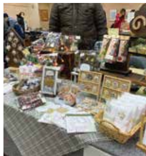
「働く障害者ふれあいフェスティバル」