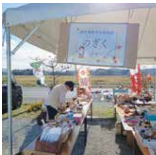
「あぐりっと収穫祭」

今回はのぎく定番商品のほか、革のペンホルダー、にゃんこキーホルダーといった新製品も店頭並び、多くのお客様にお手に取っていただきました。今後もお客様に喜んでいただけるような製品を作っていくよう励んでいきたいと思っております。