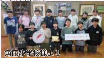
角田小学校様より

令和5年10月1日より赤い羽根共同募金運動が全国で一斉に展開され、角田市でも市民の皆様をはじめ、法人、学校、団体等、多数の方々のご協力をいただきました。ご厚意を賜りました皆様に心より御礼申し上げます。お寄せいただきました募金は、災害支援事業、子育て支援、高齢者・障がい者支援事業等に配分させていただきます。