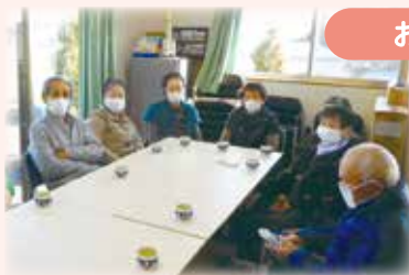
おちゃっこのむかい