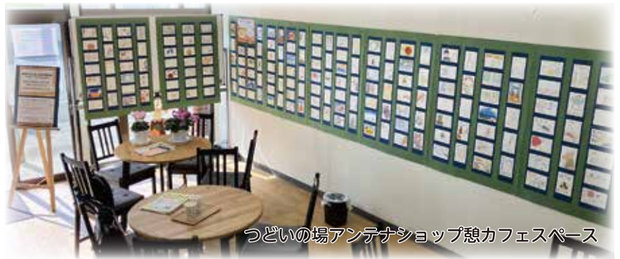
つどいの場アンテナショップ憩カフェスペース