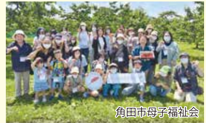
角田市母子福祉会