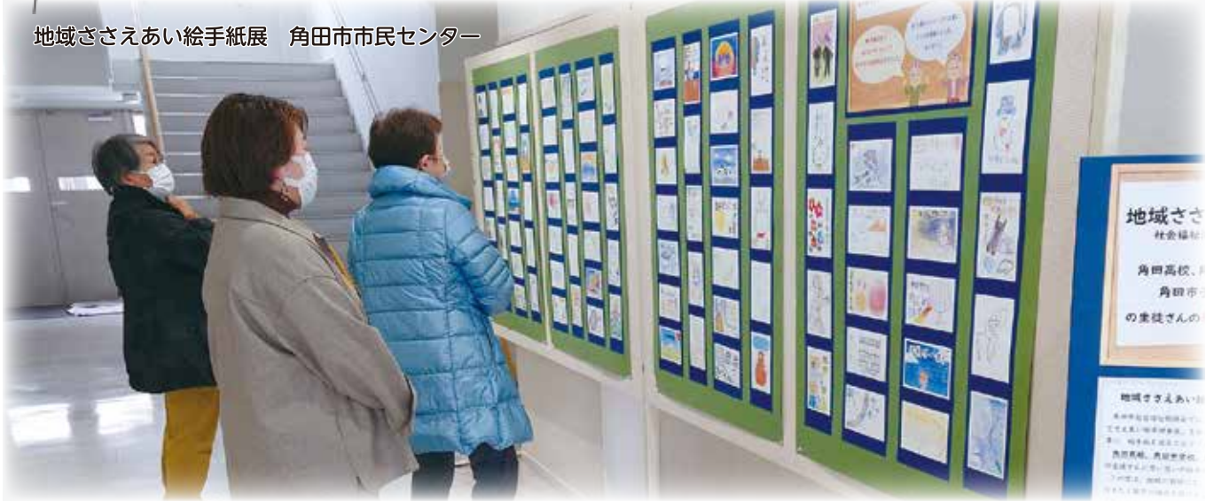
地域ささえあい絵手紙展 角田市市民センター

この広報誌は、皆様からいただいております会費と赤い羽根共同募金の配分により作成いたしました