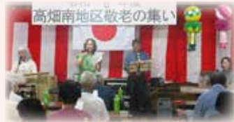
ブルーステラ(北郷地区)

4人でバンド活動をしているブルーステラ。バンド名はイタリア語で“青い星”を意味するそうです。北郷自治センターにある北郷カフェで、毎月2回火曜日に練習しています。懐かしいポップスや洋楽のヒット曲を、素敵な歌声と演奏で聴かせてくれます。ボランティアでの出張演奏も可能で、リクエストを受けて童謡を演奏することも。みなさん演奏を聴きにきませんか。