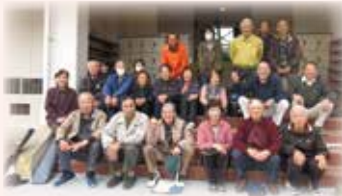
東根スポーツ交流会

毎月第3金曜日に旧東根小学校の校庭と体育館を借用し、グラウンド・ゴルフや室内競技を楽しんでいます。経験の有無にかかわらず、東根の人なら誰でも参加OK。毎月の楽しみで、ご近所さんと乗り合いで参加している人もいます。休憩にはお茶を飲みながらおしゃべりしたり、地域のプロからレッスンを受けたり、楽しみながらもより良いスコアを目指し頑張っています。文字通り、スポーツで笑顔あふれる地区の交流が行われていました。