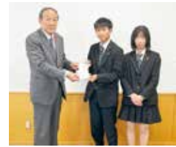
◀宮城県伊具高等学校様