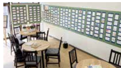
▲昨年の展示の様子