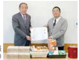
▶株式会社 ダイナム様 (物品でのご寄付)