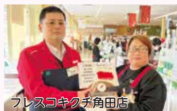
フレスコキクチ角田店