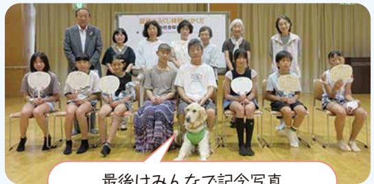
最後はみんなで記念写真