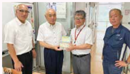
▲角田ロータリー クラブ様より