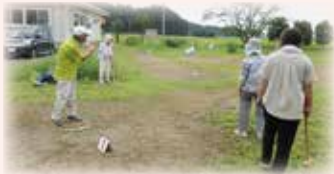
東根グラウンドゴルフ愛好会

世代交代をしながら20年以上続いているクラブ。東根自治センターホールで毎月第1・3水曜日に活動しています。活動する時には新しく作ったクラブのTシャツを着て、クラブの唄（炭坑節の替え歌）を歌ってから始まります。さんぽの曲に合わせてウォーキングをし、輪になっておらほのラジオ体操。そしてチームに分かれてニュースポーツやパークゴルフを行っています。この日はモルック対抗戦。対戦結果によっては罰ゲーム？があると聞き、和やかモードながらもみなさん真剣勝負でした。