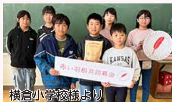
横倉小学校様より

令和6年10月1日より赤い羽根共同募金運動が全国で一斉に展開され、角田市でも市民の皆様をはじめ、法人、団体等、多数の方々のご協力をいただきました。ご厚意を賜りました皆様に心より御礼申し上げます。お寄せいただきました募金は、災害支援事業、子育て支援、高齢者・障がい者支援事業等に配分させていただきます。共同募金運動の結果につきましては、次号の「社協かくだ」でご報告いたします。