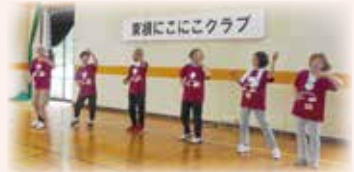
東根にこにこクラブ

世代交代をしながら20年以上続いているクラブ。東根自治センターホールで毎月第1・3水曜日に活動しています。活動する時には新しく作ったクラブのTシャツを着て、クラブの唄（炭坑節の替え歌）を歌ってから始まります。さんぽの曲に合わせてウォーキングをし、輪になっておらほのラジオ体操。そしてチームに分かれてニュースポーツやパークゴルフを行っています。この日はモルック対抗戦。対戦結果によっては罰ゲーム？があると聞き、和やかモードながらもみなさん真剣勝負でした。