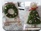
「11月 ワークショップ」

のぎくでは、昨年より道の駅かくだのフードコートで毎月第3火曜日にワークショップを開催しています。季節に応じたワークショップを展開しており、わんぱいんとふきんや木工製品を、のぎくのスタッフと学びながら作る事ができます。また、子ども会の行事としてハロウィンスタンドづくりも行い、親御さんと楽しくいい思い出を作っていました。