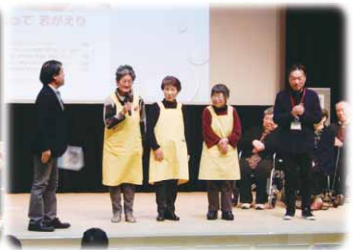
新中島北区 談笑サロンひだまり