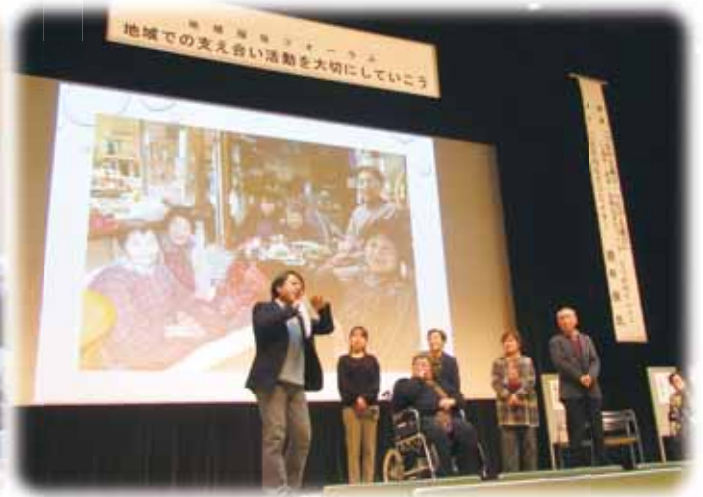
平貴下行政区 後藤商店