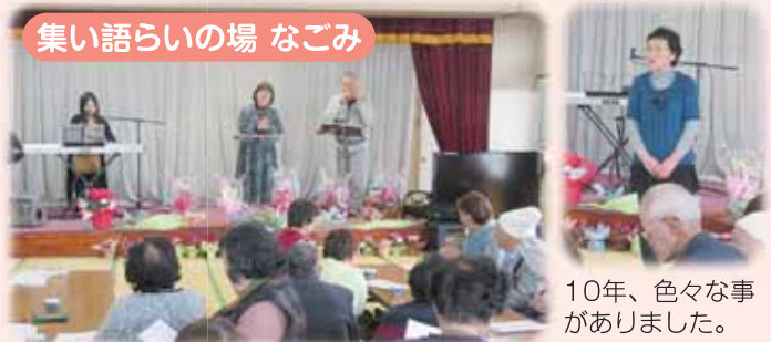
集い語らいの場 なごみ

ヨガ経験のある利用者さんの指導でじっくりと身体をほぐしています。絶妙な語りの紙芝居やビンゴゲームなど、たくさんの楽しい時間が過ぎていきました。