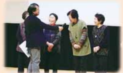
会場全体が笑いに包まれました