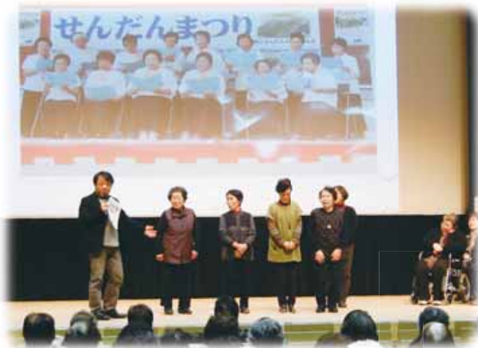
西根2区 わらべの会