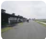
「関上かわまちテラス」