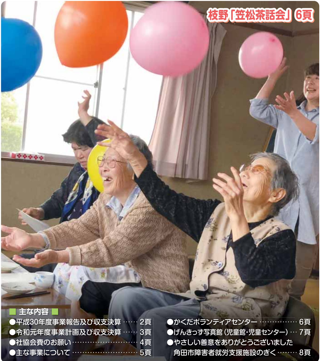
枝野「笠松茶話会」6頁