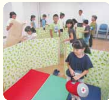
昨年度の防災体験の様子 避難所づくりに挑戦しました