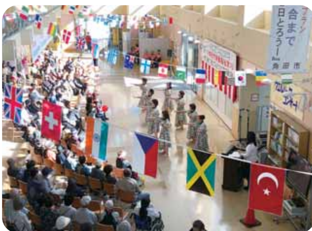
第17回角田市保健福祉まつり