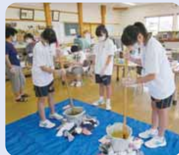
昨年度の石饅作り体験 角田市障害者就労支援施設のぎくにて

申込方法 学校を通して申込みください。市外に通学の方は 直接、社会福祉協議会へ申込みください。 詳しくは、角田市社会福祉協議会(かくだボランティア センター)へお問合せください。