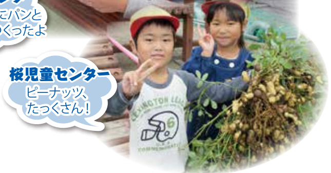
桜児童センター ピーナッツ たっくん!

藤尾5区環境保全隊の皆さんと一緒に植えたさつまいもが、 台風にも負けずに大きくなり芋掘りが出来ました