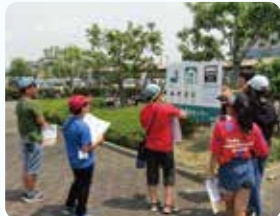
ピクトグラム探検で 絵文字探し

令和元年7月30日（火）、角田市総合保健福祉センター（ウエルパーク）で、小学生4～6年生を対象に「夏休みふくし体験inかくだ」を開催しました。