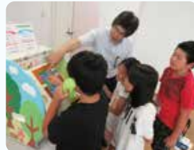
公益財団法人公衆電話会の方 による体験機を利用した災害 用伝言ダイヤル（171）の体験