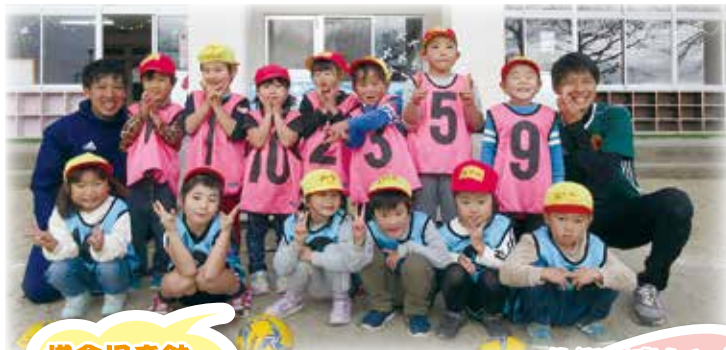
横倉児童館 大好きなコーチとサッカー をして楽しかったよ!