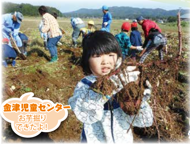
金津児童センター お芋掘り できたよ!