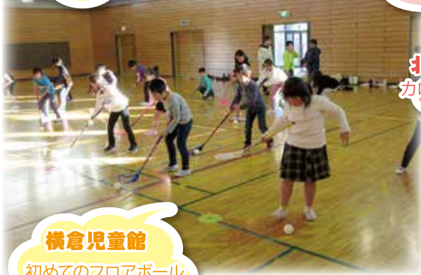
横倉児童館 初めてのフロアボール 楽しかったよ!