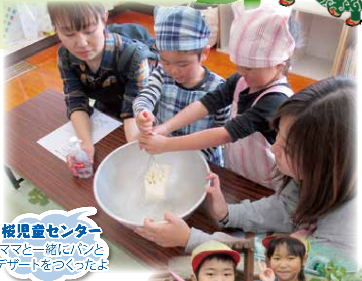
桜児童センター ママと一緒にパンと デザートをつくったよ

藤尾5区環境保全隊の皆さんと一緒に植えたさつまいもが、 台風にも負けずに大きくなり芋掘りが出来ました