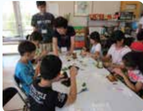
角田市障害者就労支援施設の ぎくて製品作り