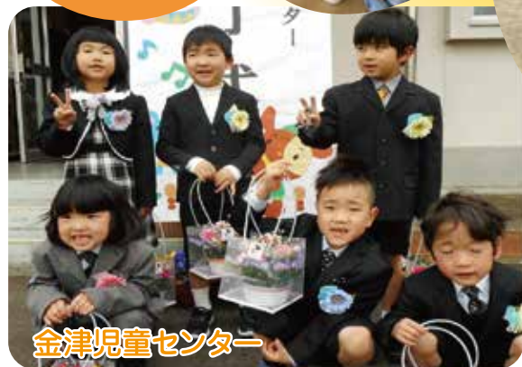
金津児童センター

先生からの メッセージ 笑顔、元気いっばい の4人で毎日楽しく遊 んだね。 いつまでも、みんな なかよしていてね♡