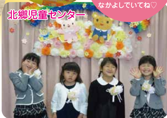
北郷児童センター