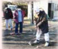
みんなが見つめる先は第1ゲート!

蔵王が一望に臨めるロケーションのコートで、毎週2回の定例ゲートボールを続けています。