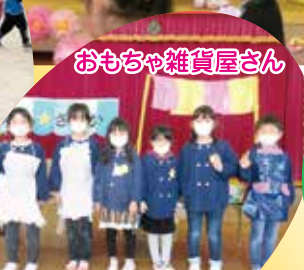
おもちゃ雑貨屋さん

先生からの メッセージ みんなとたくさんあそ んだね。 かくれんぼ、おにごっ こ大好き!