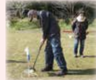
今日のメンバーはほんの一部 全員集まれば20人を超す大所帯です

西根自治センターを拠点に楽しく活動を続けてきました。コロナの影響で全員が一堂に会することが難しくなってからは「せんだん公園」でのグラウンドゴルフをメインに集まりを続けています。