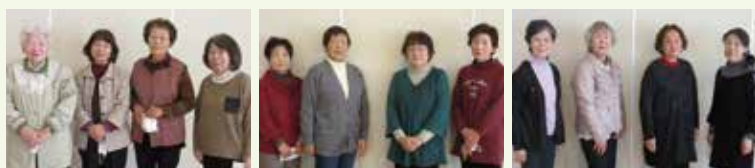
※撮影のため、マスクを外しています