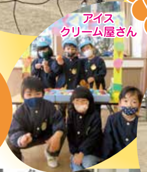
アイス クリーム屋さん