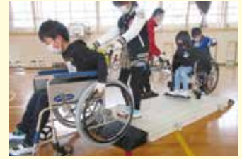
小学校での福祉体験の様子