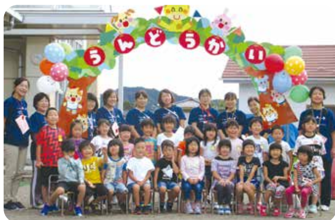
横倉・桜・金津・北郷4館最後の児童館合同運動会 令和2年9月実施