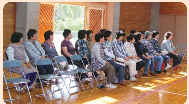
藤尾ボランティア友の会の方々

今回の取材で、毎年いただいていたご寄付がこんなにたくさんの方々の手で苦勞して集められたものだということがわかりました。また、生徒さんのご家族や地元ボランティアの方々も前日から採取に協力し、地域みんなが一丸となっている姿に、こころ温まる思いがしました。