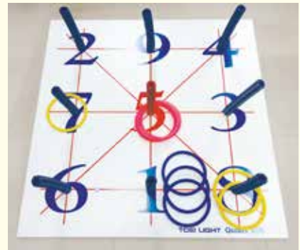
ソフトバー輪投げ