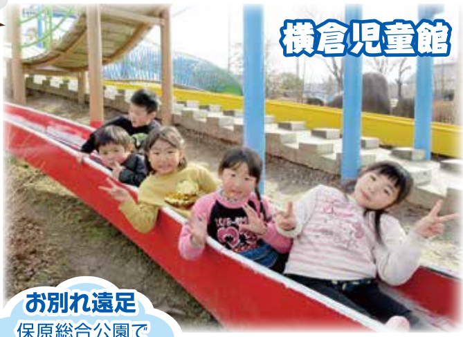
お別れ遠足 保原総合公園で いっぱい遊びました。