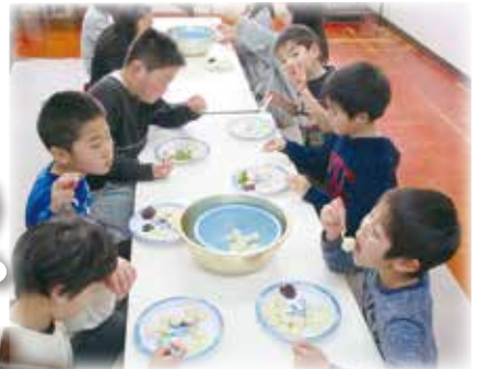
お正月 自分で作った おもち、最高!!