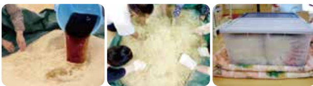
原材料を混ぜ合わせる