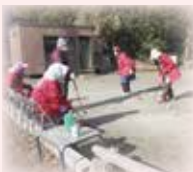
狙いを定めて… 全集中!

風呂公民館北側のコートで、「はい、やるよ〜!」と元気な掛け声で始まるゲートボール。「ダメだ〜」「今度はいいね!」などと声をかけ合いながら賑やかに活動しています。