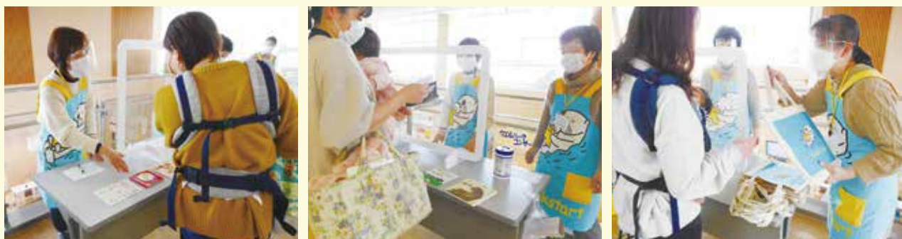
ボランティアの方々に協力いただき、感染症対策をしながら、選んでもらった絵本をプレゼントしています。