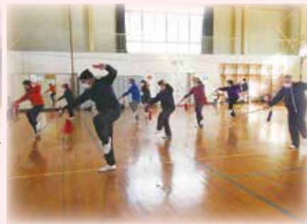
旧小田小学校体育館で、総勢約50名の方が午前・午後の2部制に分かれ、いきいきと活動している皆さんです。