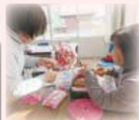
ハート形の花びらは切るコツがあるのよ!

以前、職場が一緒だったというメンバーの皆さん。北郷カフェで、クラフトテープを使いバックや小物などを製作しています。簡単過ぎず、難し過ぎない作品を作ることにより、やりがいを感じ、完成した時の達成感が味わえる。また、同じ作品を作ってもそれぞれの“味”が出てそれもまた良いと話していました。気兼ねしない仲間だから、難しい作業があっても楽しんでできる。「手づくりの会」は日頃の気分転換の場所になっているようです。