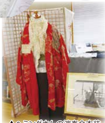
▲ヘミングさんの演奏会衣装