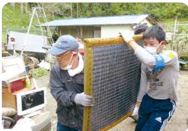
令和元年東日本台風により 角田市災害ボランティアセンターを設置