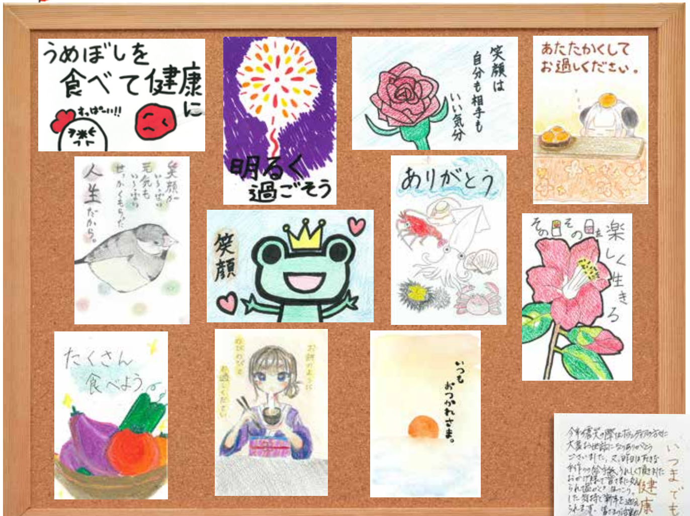
※絵手紙については承諾をいただき、複製した作品をアンテナショップ「憩」で展示しました。5頁に詳しく紹介しております。

この広報誌は、皆様からいただいております会費と赤い羽根共同募金の配分により作成いたしました