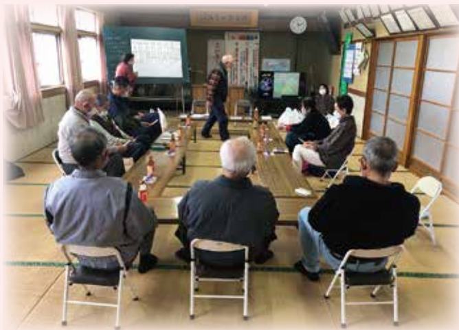
男性メンバーが多めです!